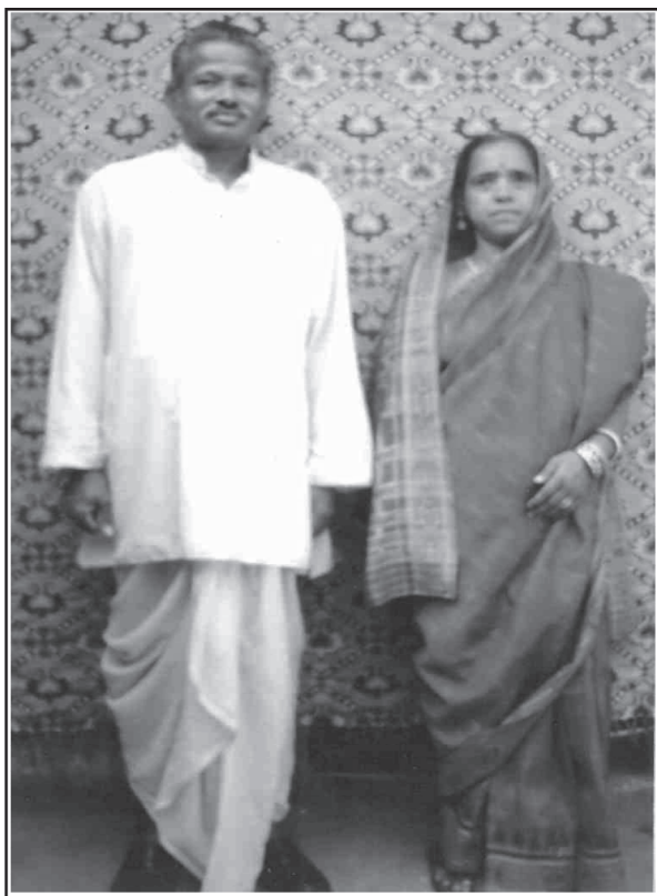
ସ୍ଵାମୀ - ରାମଚନ୍ଦ୍ର କ ଗୃହଣରେ ଭାରତୀ ଦେବୀ ।